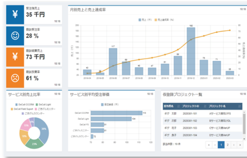
ダッシュボード画面